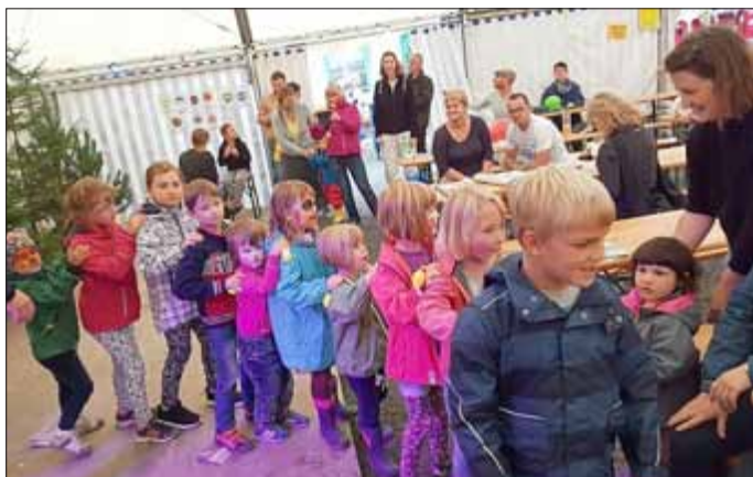
Hainer Kirmesgesellschaft e. V.

Vom 1.9. bis 3.9. fand im Stadtteil Hain die 13. Hainer Kirmes statt. Mit viel Mühe und einer Menge Stunden Vorbereitungsarbeit wurde wieder ein sehr ansprechendes Programm zusammengestellt.