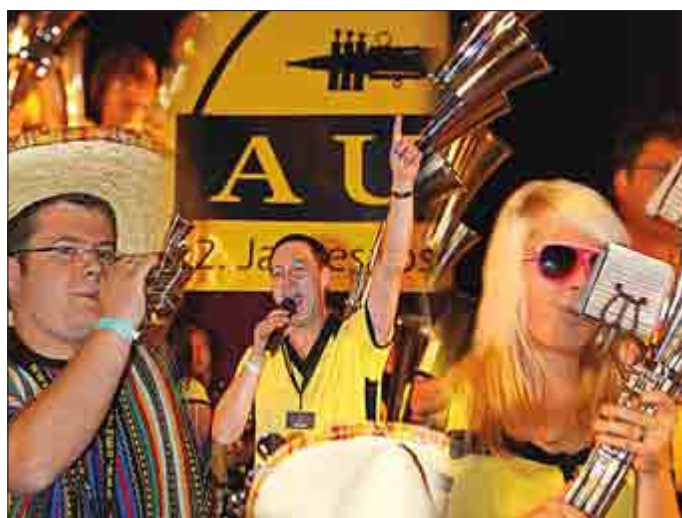
1. Schalmeienmusikzug Auma