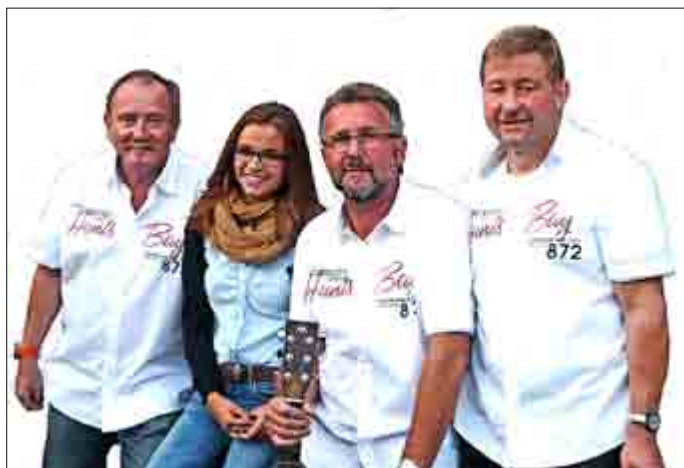
„memory-band“ aus Eisenberg