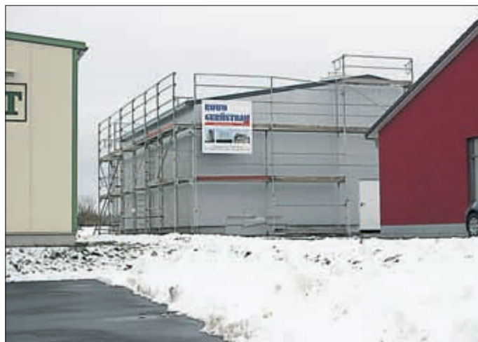
Neubau Lagerhalle der Firma Bramburger.