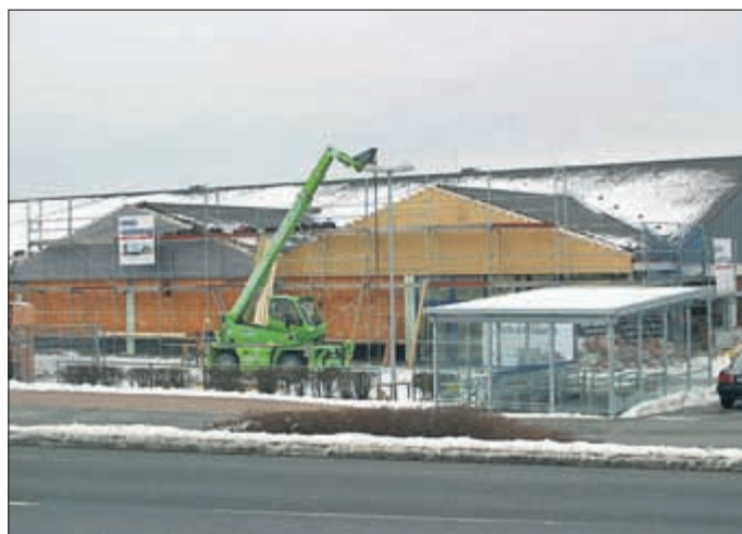
Erweiterung des Lidl-Marktes.