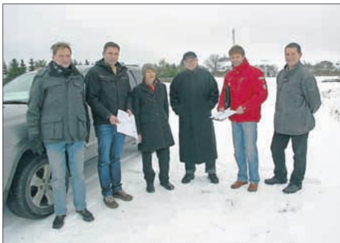
Am 29.1. fand die erste Planungsbesprechung statt.