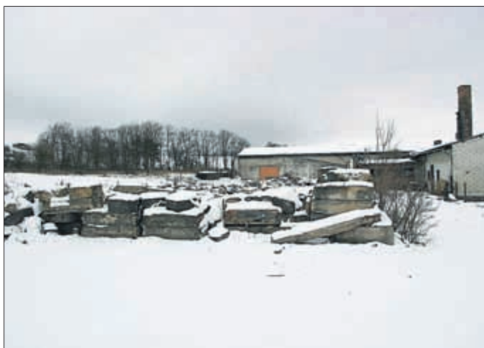
Im Dezember 2013 erfolgte der Teilabriss der Stallanlagen.

Bei der Entwicklung von Gewerbestandorten muss die Stadt Bad Lobenstein als Erschließungsträger die Flächen für Betriebsansiedlungen kostengünstig bereitstellen. Im Werben um attraktive Unternehmen stehen wir im Wettbewerb mit anderen Kommunen. Dabei leidet die Stadt unter der angespannten Haushaltslage. Die Aufgabe besteht in dieser Situation darin, die Erschließungsanlagen zwar flächen- und kostensparend herzustellen, aber die Gewerbegebiete städtebaulich dennoch attraktiv zu gestalten, denn die Gewerbetreibenden als Nutzer dieser Flächen errichten ihre Betriebe nur in Gebieten mit gutem Image und stellen hohe Ansprüche an die Funktionalität der öffentlichen Versorgungs- und Verkehrslagen. Gleichwohl legen sie Wert auf niedrige Grundstückskosten und Erschließungsbeiträge. Zu den Erschließungsanlagen eines Gewerbegebietes gehören Anlagen zur Verkehrserschließung, Anlagen für den ruhenden Verkehr, Nebenanlagen, wie z. B. Straßenbeleuchtung, Versorgungsanlagen, Entsorgungsanlagen/Abwasser, Grünanlagen und die Gestaltung der Betriebsgrundstücke.