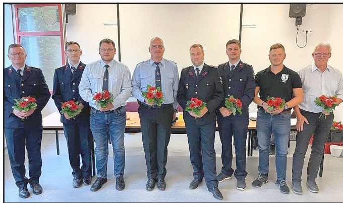
Verabschiedung alte Wehrleitung

Seit Februar 2021 ist die Bad Lobensteiner Feuerwehr mit dem Löschboot des Landkreises ausgestattet. Dies macht selbstredend auch Übungsfahrten auf dem Bleilochstausee erforderlich. Leider sehen das nicht alle Anrainer so. Deshalb kam es schon wenige Tage nach Indienststellung des Bootes zu ersten anonymen Beschwerden. Geübt wird, um in der Not helfen zu können. Dass es sich um ein Rettungsfahrzeug handelt, war Langfingern dann auch egal. Sie entwendeten die beiden Bootsmotoren, sodass der Landkreis auch hierfür Ersatz beschaffen musste – Schaden 30.000,00 €!