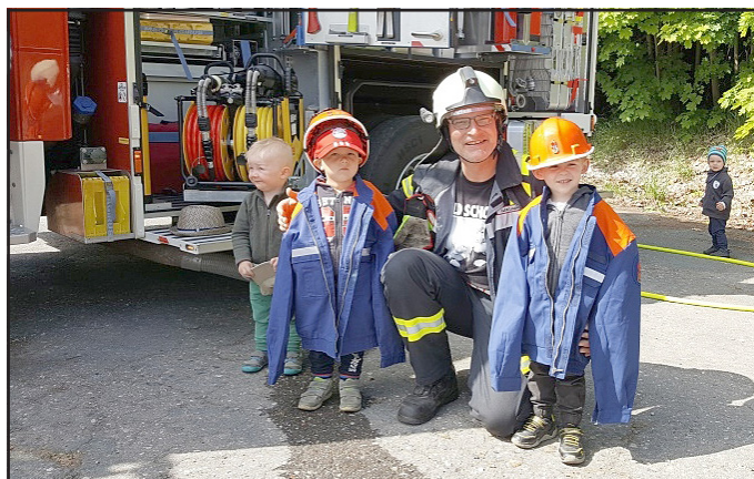
Das Erzieherinnenteam der Hasen- und Bienchengruppe

Vielen lieben Dank an alle, die diesen unvergesslichen Tag ermöglichten.