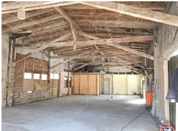
Baustand Güterhalle Bahnhofsgebäude

Informationen zum Bau einer barrierefreien ÖPNV-Haltestelle finden sie unter der Rubrik „Das Bauamt informiert“.