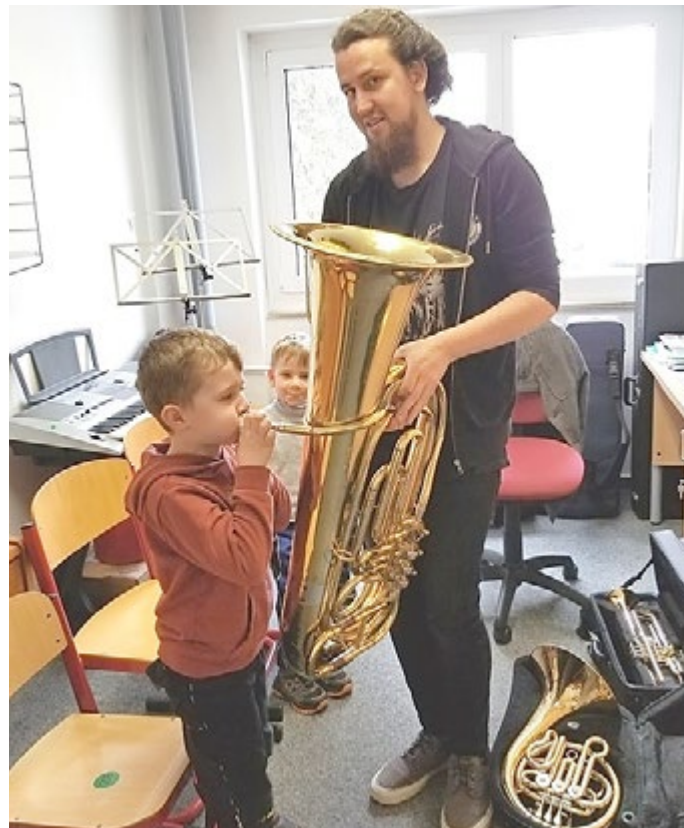
Das Team des Kindergartens „Kinderland“

Das war ein sehr schöner Tag, vielen Dank dafür.