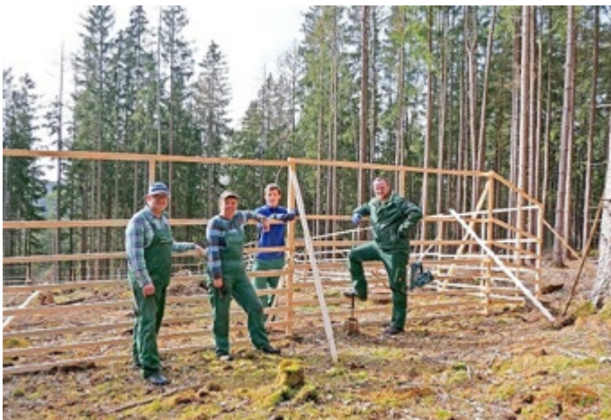
Gemeinsam wurden Hordengatter zwischen Lichtenbrunn und Lichtenberg gestellt

Der neue Arbeitsbereich der Firma LobTec gGmbH stellte nun 1000 Meter Hordengatter im Auftrag der Stiftung Naturschutz Thüringen zwischen Lichtenbrunn und Lichtenberg auf.